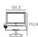
Floor Stand 5 MU SP Глубина телевизора: 9,0 Общая глубина: 56,0