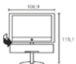
Floor Stand 5 MU SP Глубина телевизора: 12,1 Диаметр подставки: 56,0