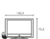
Table Stand Глубина телевизора: 12,1 Общая глубина: 27,7