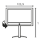
Floor Stand 4/ Floor Stand 4 MU Глубина телевизора: 12,1 Диаметр подставки: 50,0