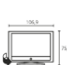
Table Stand Глубина телевизора: 12,1 Общая глубина: 27,7